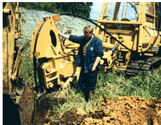
Для повышения надежности сетей необходимо жесткое выполнение технологии строительства ВОЛС

При проектировании ВОЛС необходимо учитывать технические характеристики различных типов оптических кабелей, оптических муфт и оконечных устройств. Требования к оконечным устройствам приведены в статье "Укrocение ВОЛС" ("Сит" №8-9, 2003), а требования к оптическим муфтам – в статье "Все дело в муфте" ("Сит" №10, 2003).