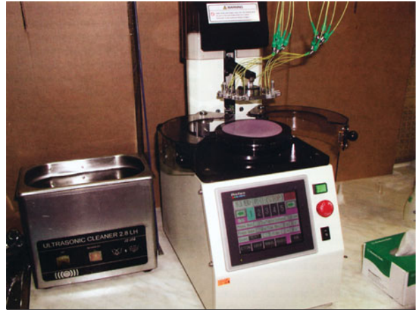
Полировальный станок Seiko Instruments OFL-15

ное оборудование, а также повысится уровень технического обслуживания ВОЛС и надежность сети связи в целом.