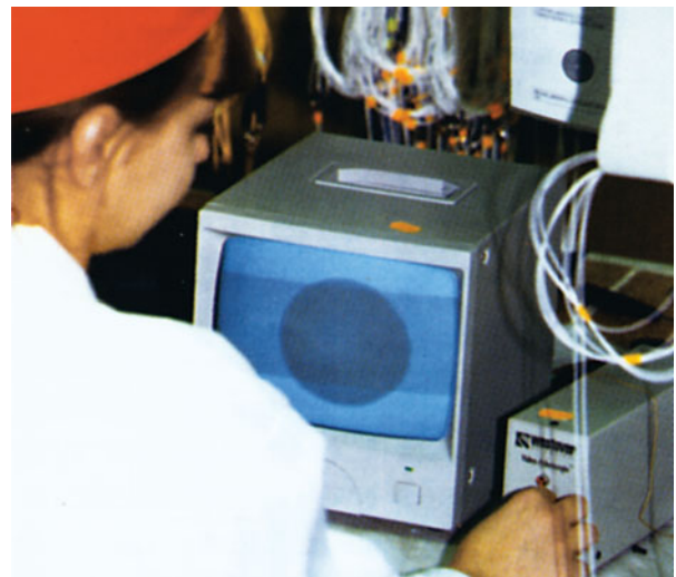
Оптические шнуры должны проверяться на стойкость к механическим и климатическим воздействиям

Основной задачей при проектировании волоконно-оптических сетей является не только обеспечение потребностей сегодняшнего дня, но и гарантия возможности дальнейшего гибкого роста сети с органичным включением ранее построенных фрагментов. При этом сеть должна быть достаточно надежной. Безусловно, уровень надежности проектируемой сети напрямую зависит от вложенных в строительство средств. Проблема