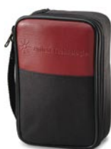
U1174A – Мягкая сумка для переноски