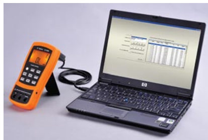
Рис. 1. Автоматизированная регистрация результатов измерений при подключении U1701A/U1701B к ПК

Ручные измерители ёмкости выпускаются в прочном корпусе, изготовленном по технологии многокомпонентного литья, и соответствуют самым строгим промышленным стандартам. Приборы поставляются с трехлетней гарантией. Вы можете быть уверены в достоверности результатов измерений.