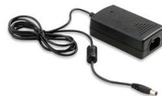
U1780A – Адаптер для питания от сети переменного тока и сетевой кабель для выбранной страны