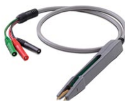
U1782A – Измерительный кабель с пробником для элементов SMD