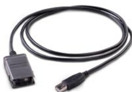
U5481A – Кабель IR-USB