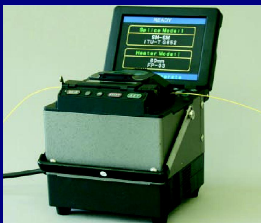
Верхнее расположение экрана